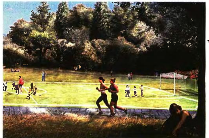
Πράσινες διαδρομές. Απεικόνιση της διαδρομής περιπάτου που θα συνδέει τη Λεωφόρο Ποσειδώνος με τη Λεωφόρο Βουλιαγμένης