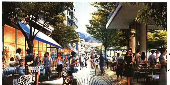
Ήπιες εμπορικές χρήσεις. Απεικόνιση εμπορικών καταστημάτων και χώρων εστίας, ενώ στο βάθος διακρίνεται τμήμα του υφιστάμενου οικιστικού ιστού

κανολογικές υποδομές, διευθέτηση ρεμάτων, κατασκευή δικτύων διαχείρισης λυμάτων και αστικών αποβλήτων, διαμόρφωση κοινόχρηστων χώρων κ.ο.κ. Στη φάση αυτή προβλέπεται και η υπογειοποίηση τμήματος περίπου 1.100 μέτρων της Λεωφόρου Ποσειδώνος. Ταυτόχρονα, προβλέπεται να αρχίσει η διαμόρφωση σε ποσοστό 45% του μητροπολιτικού πάρκου. Στη φάση αυτή θα ξεκινήσει η ανάπτυξη του παράκτιου μετώπου και του μητροπολιτικού πάρκου, με αναβάθμιση της μαρίνας, κατασκευή του ενυδρείου και του ξενοδοχείου της μαρίνας 170 δωμυτίων. Ταυτόχρονα προβλέπονται η μεταφορά και ο εκσυγχρονισμός των αθλητικών εγκαταστάσεων του Αγίου Κοσμά σε ειδικό χώρο εντός του μητροπολιτικού πάρκου. Κατά την ίδια περίοδο, σχεδιάζεται η ολοκλήρωση της ανακαίνισης του ιστορικού κτιρίου του πρώην ανατολικού αεροσταθμού (σχεδιασμού Eero Saarinen) το οποίο και έχει κριθεί διατηρητέο.