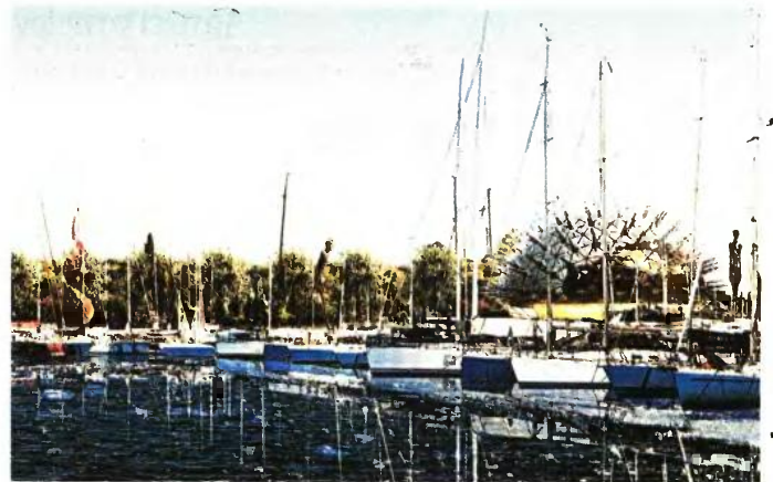
Στο παραλιακό μέτωπο. Η μαρίνα που είχε κατασκευασθεί για τους Ισποπλοϊκούς Αγώνες των Ολυμπιακών Αγώνων της Αθήνας 2004 και έχει τη δυνατότητα φιλοξενίας 337 σκαφών. Στο βάθος διακρίνεται και το ενυδρείο

Τέλος, στην περιοχή της Λεωφόρου Βουλιαγμένης, δίπλα στον οικιστικό ιστό του Δήμου Αλίμου - Αργυρούπολης, θα αναπτυχθούν δύο ακόμα κτίρια, ένα γραφείων και ένα ξενοδοχείο. Στην πράξη, οι χρήσεις και η σχεδίαση θα είναι τέτοιες προκειμένου να συνδέσουν τον υφιστάμενο οικιστικό ιστό με το έργο του Ελληνικού, αφού θα λειτουργούν ως πύλες εισόδου στο μητροπολιτικό πάρκο.